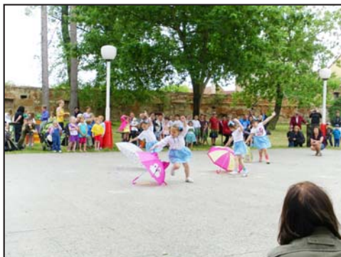
Dětský den v Říkovcích