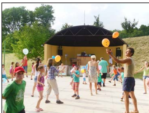
Dětský den ve Staré Vsi