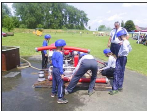
Cvičení mladých hasičů v Troubkách