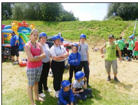
Cvičení mladých hasičů v Troubkách