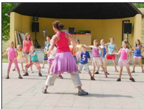
Dětský den ve Staré Vsi