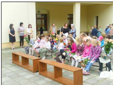
Konec školního roku v ZŠ Stará Ves